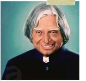
ଡଃ ଏ. ପି. ଜେ. ଅବତୁଲ କଲମାମ

ତୁମର ପ୍ରଥମ ବିଜୟ ପରେ ବିଶ୍ରାମ ନିଅ ନାହିଁ କାହିଁକି ନା ଯଦି ଦ୍ୱିତୀୟ ରେ ଅସଫଳ ହେବ, ତେବେ ଲୋକେ କହିବେ ତୁମର ପ୍ରଥମ ବିଜୟ ଏକ ଭାଗ୍ୟର ଖେଳ ଥିଲା ।