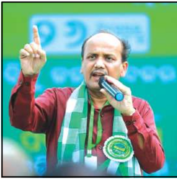
ରେଡ଼ଆଉଟ କରି ଚଳିଥିବା ସହ ଚୁପେ କେଲ ଯାଇଛି, ମୋ ଗାଡି କାଟ ଭାଙ୍ଗିଛି ଆଦି ବିଭିନ୍ନ ପ୍ରକାରର ତାହଲ୍ୟଭରା କଥା କହିବା ସହ ଦଳରୁ ମଧ୍ୟ ବହିଷ୍କାର କରିଥିଲେ । ଯଦି ସେ ଭୁଲ କରିଥିଲେ, ତାହଲେ ସତ କଣ ସର୍ବସାଧାରଣରେ ଦଳ ପକ୍ଷରୁ କାହିଁକି ପ୍ରକାଶ