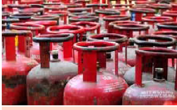
୨୦୦୦ ଟଙ୍କାରେ ସିଲିଣ୍ଡର ବିକ୍ରୟ ହେଉଛି ନେତା

ଲକ୍ଷ୍ନୌ : ଦେଶରେ ବାଲିଥିବା ଏଲପିଜି ସଙ୍କଟ ମଧ୍ୟରେ ଉତ୍ତର ପ୍ରଦେଶର ଜଣେ ନେତାଙ୍କ ଘରୁ ୫୫ଟି ସିଲିଣ୍ଡର ଜବତ ହୋଇଛି।