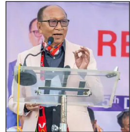
ମଣିପୁରରୁ ହଟିଲା ରାଷ୍ଟ୍ରପତି ଶାସନ ନାଗା ସଂପ୍ରଦାୟର ଲୋସି, କୁକିର ନେମତା ଉପମୁଖ୍ୟମନ୍ତ୍ରୀ

ବେଆଇନ ଖଣି ଖନନ ସ୍ଥାନୀୟ ଅଞ୍ଚଳରେ ବନ୍ଦ ହୋଇ ନାହିଁ। ମୁଖ୍ୟ ଗାତ ମାଇନିଂ ସାଧାରଣତଃ ଅଣ ଓସାରିଆ ଚଳେଇଲୁ ଖୋଲି କରାଯାଏ। ଏହା ଉଚିତ ପ୍ରାୟ ୩ରୁ ୪ ଫୁଟ। ଏହା ମଧ୍ୟରେ ଶ୍ରମିକମାନେ ବିପଦଜନକ ଅବସ୍ଥାରେ ପ୍ରବେଶ କରି ଖଣି ଖନନ କରନ୍ତି। ଏଥିରେ ଗୋଟିଏ ସମୟରେ ଜଣେ ହିଁ ପଶି ପାରିବାର ସୁବିଧା ରହିଥାଏ। ୨୦୧୪ରେ ଜାତୀୟ ଗ୍ରାନ ଟ୍ରିବ୍ୟୁନାଲ ଦେଇଥିବା ରାୟକୁ ସୁପ୍ରିମକୋର୍ଟ କାଏମ ରଖିଥିଲେ ଓ କେବଳ ବିଜ୍ଞାତ୍ତ୍ୱିକ ଖଣି ଖନନକୁ ଅନୁମତି ଦେଇଥିଲେ। ହେଲେ ମେଘାଳୟରେ ନିୟମିତ ଭାବେ ବେଆଇନ ଖଣି ଖନନ ଜାରି ରହିଛି। ଏବେ ଏଥିଯୋଗୁ ଏତେ ବଡ଼ ଅଘଟଣ ଘଟିଛି।